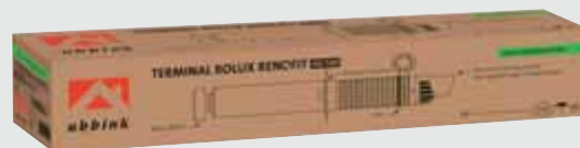
Terminal Horizontal Rolux Renofit®

MONTAGE PAR L'INTÉRIEUR 1 SEULE PERSONNE SUFFIT*